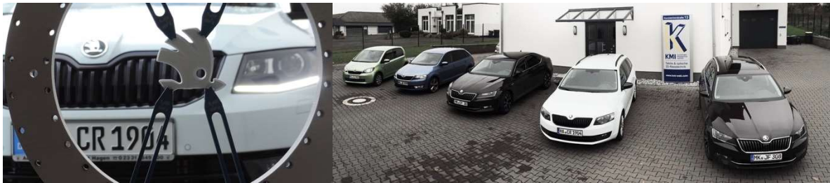
Das Škoda-Emblem im neuen KSystems „Spider“ und am Fahrzeug.